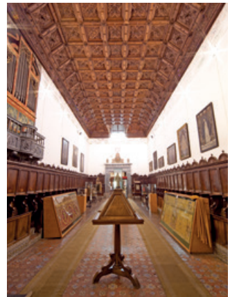
Coro de Santo Domingo "El Antiguo" / Choir of Santo Domingo "El Antiguo".

Convento de Santa Isabel de los Reyes. Arco Múdejar con yeserías / Convent of Santa Isabel de los Reyes. Mudejar arch with plasterwork.