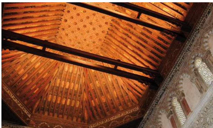
Sinagoga del Tránsito. Sala de oración.