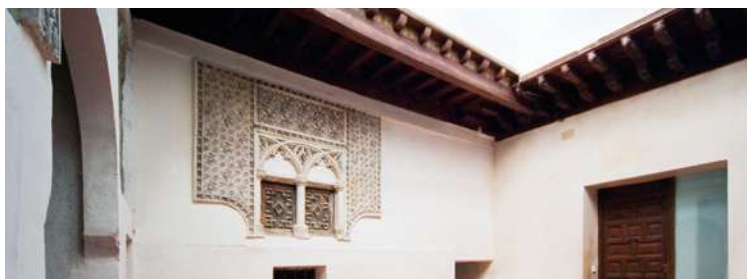
"Casa del Judío". Patio.