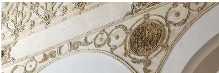
Sinagoga de Santa María la Blanca

Cuando la judería poseía las necesarias instituciones de uso público para el buen funcionamiento de su devenir cotidiano -sinagoga, cementerio, hospital, escuela, baños, carnicería, horno, taberna, etc.-, se la denominaba aljama de los judíos, para diferenciarla de la aljama de los moros. Funcionaba como una pequeña ciudad dentro de la ciudad misma, siendo gobernada por sus propias autoridades, a cuyo frente se encontraba el rabbi o judío mayor, designado por el rey, y rigiéndose siempre por la normas jurídico-religiosas que marcaba la Ley Sagrada hebreaica .