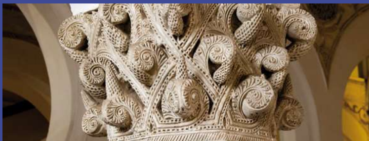
Sinagoga de Santa María la Blanca