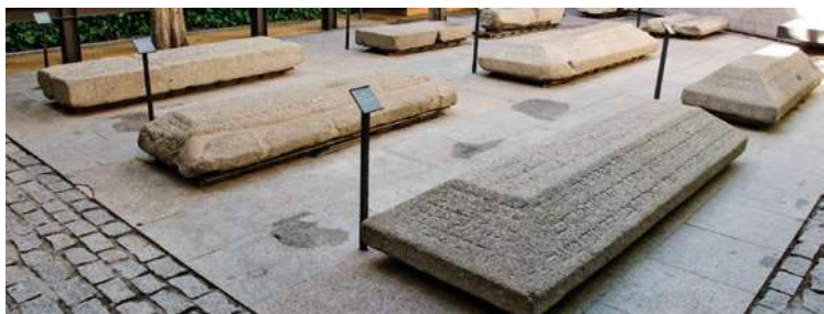
Lápidas funerarias con inscripciones hebreas. Museo Sefardí.

The coexistence of two cultural universes, that were so different from each other, propagated myths and legends between the Jewish and Christian populations in Toledo. The fables concerning the Jewish people rarely represented reality, yet nevertheless remained part of the imagination of the people up until modern day. In the city's oral tradition there is the famous case of the martyr Santo Niño de la Guardia . His story takes place in the year 1489, when several Jewish figures take their revenge out on an innocent Christian boy, Cristóbal, who was asking for a handout with his blind mother at the Puerta del Perdón of the Toledan Cathedral.