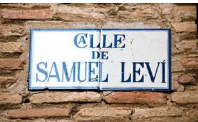
Judería Toledana. Calle de Samuel Levi.

La Leyenda del Pozo amargo , es otra de las fábulas anónimas que cuenta con mayor fervor popular entre los toledanos. Recuerda los amores entre un cristiano, Fernando y su amada judía, Raquel, acabados en tragedia. El potentado padre, judío, asesina al joven cuando se dirige a la diaria cita nocturna en el jardín de su casa. Raquel acude a todas las noches a la cita imaginaria con su amado junto al brocal del pozo. Allí vierte sus lágrimas hasta que un día las aguas se vuelven amargas. Una noche, en su desvarío, es atraída por la imagen de Fernando que cree ver reflejada en el fondo de aquél, y se lanza a su fondo. La leyenda dio nombre a la calle, próxima a la Plaza del Ayuntamiento , que todavía conserva el solitario brocal.