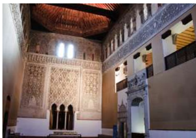
Sinagoga del Tránsito. Sala de oración.

In 1494 the Catholic Kings handed over the synagogue to the Order of Calatrava , under which it served as a hospital and convent. In the XVI Century it was a church, adding sculpted tablets onto the main altar, and a vestry with a beautiful arch at its entry. In the XVII it was known as the Tránsito , because of the canvas of “ Tránsito