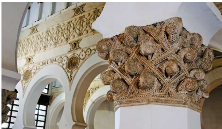
Sinagoga de Santa María la Blanca