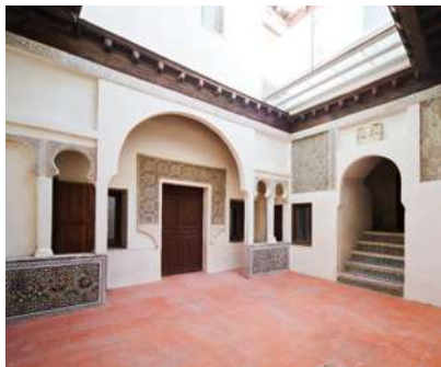
“Casa del Judío”. Patio.

Desde el s. VIII, la judería toledana se emplazaría en la parte sudoeste de la ciudad, intramuros, llegando a alcanzar en su momento de máxima extensión, en 1350, desde las inmediaciones del actual barrio de Santo Tomé -en sus cercanías se abrirían dos portillos para acceder a la