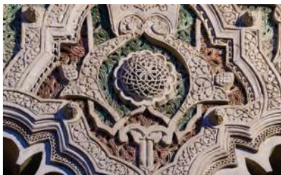
Sinagoga del Tránsito

Conocida en otros tiempos como Sinagoga Nueva de Yosef ben Shoshan , rico personaje próximo a la corte, o también Sinagoga Mayor , es una de los once templos judíos que, al parecer, tuvo la ciudad. Se construyó en el s. XIV siguiendo la estética prenazarí. Ubicada entre muros de pobre aspecto, nada hace presagiar la gran belleza que esconde en su interior: cinco naves separadas por