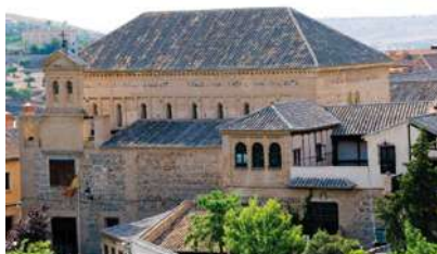
Sinagoga del Tránsito

The Jewish cemetery of Toledo is located in Vega Baja , by San Bartolome, near a hard to recognize chapel of the present Cristo de la Vega Church . In the Museum of Santa Cruz there are conserved the gravestones of Hebraic tombs. Also, on the Calle de la Plata, number 9 , on the lintel of the door