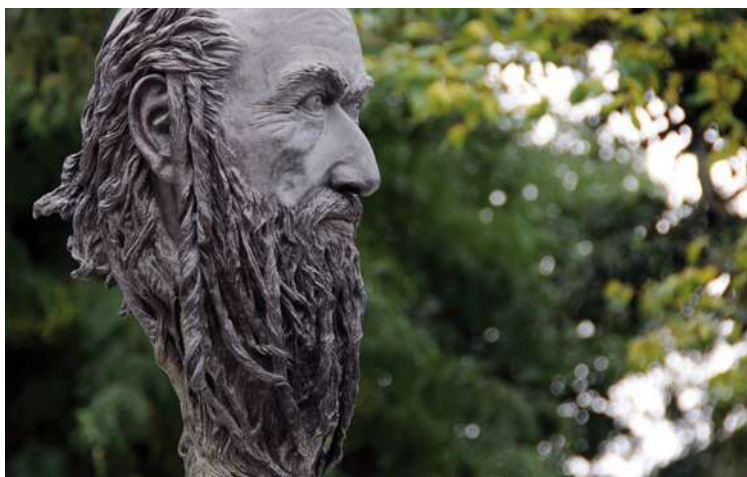
Busto de Samuel ha-Leví