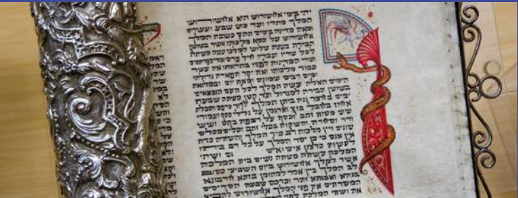
Museo Sefardí. Detalle de escritura hebrea.