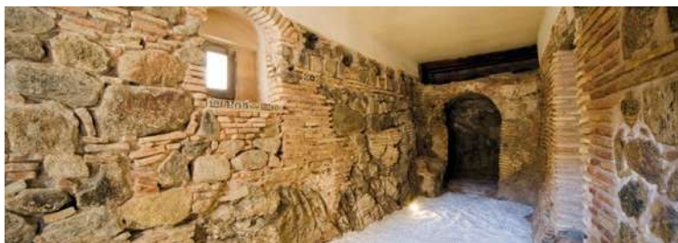
"Casa del Judío". Sótano.