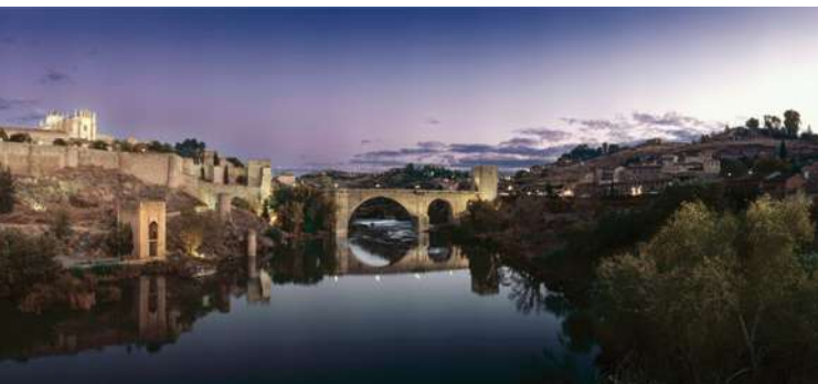
Judería de Toledo. Puente de San Martín.

It is easily accessible by public transportation: The high speed train (AVE) leaves 22 times a day and will take you to Madrid in 25 minutes, Barcelona in 2 hours and 38 minutes, and Cordoba in 1 hour and 40 minutes.