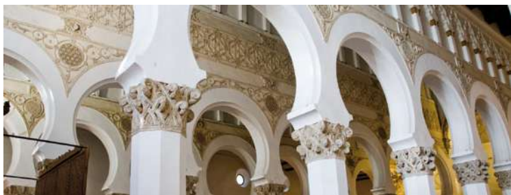
Sinagoga de Santa María la Blanca

Intrigue during the years 1359-1361 and the powerful economic recourse of Semuel ha-Leví , treasurer of the King Pedro I de Castilla (who would give express approval for a project at a point that when there was a hold on construction of synagogues) helped bring the edifice into existence. The present day Museum of El Greco was the house of this rich Toledan, and to this day there are still conserved the magnificent