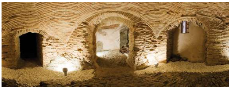
“Casa del Judío”. Sótano.

The rest of the Christian population lived within five neighbourhoods. The area known as the Judería Mayor , which was well walled and had many doors, was situated on the outer edges of the Barrio Nuevo Plaza , very close to Santo Tomé . It is worth mentioning that the house located at number 4 of the Travesía de la Judería is an authentically conserved Jewish home. It is known as “ House of the Jew ” and has within it some precious Mudejar artifacts. The Jewish Slaughterhouse district, found nearby, has a flour mill, a slaughterhouse, shops, and a hospital, all located near the San Martín Bridge . The very populous area