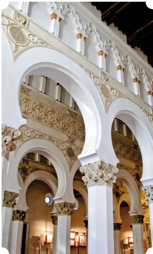
Sinagoga de Santa María la Blanca