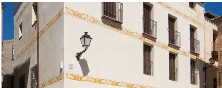
Travesía de la Judería

del barrio principal, cercano al actual monasterio de San Juan de los Reyes y el Cerro de la Virgen de Gracia , con su magnífico mirador a los cigarrales y el Tajo, que tuvo una sinagoga y una escuela. Muy habitado y popular, fue despoblado a consecuencia de los sucesos de 1391, donde la prédica antisemita del clérigo de Écija, Ferrán Martínez , propició la persecución generalizada de los hebreos toledanos. Caleros , ubicado en el entorno de la popular plaza de Valdecaleros , muy próximo a Santo Tomé , aislado y sin muralla, con sinagoga y cuyos habitantes hebreos lo habían abandonado casi totalmente a principios del s. XV. En el interior de estos barrios citados vivía la mayor parte de la población judaica, aunque también había pequeños “barrios” mercantiles dentro de la ciudad cristiana, El Alcaná (del que habla Cervantes en el Quijote y recorrería también Mateo Alemán), emplazado en los alrededores donde hoy se levanta el claustro de la catedral, entre la actual Cuatro Calles hasta la iglesia de Santa Justa , La Alcaicería de los Paños , hoy Calle de la Sinagoga , y la larga calle comercial de los Alatares , que llegó a tener 84 tiendas, en la actualidad, Calle de las Cordonerías .