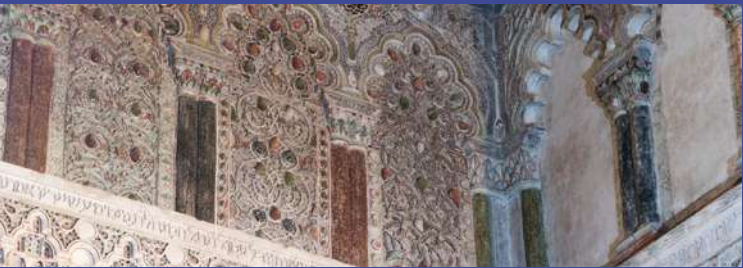
Sinagoga del Tránsito