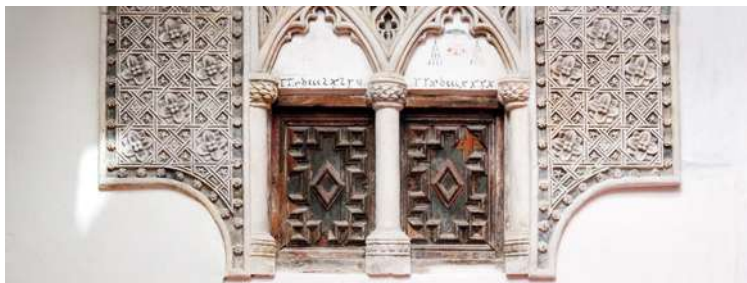
"Casa del Judío". Patio.